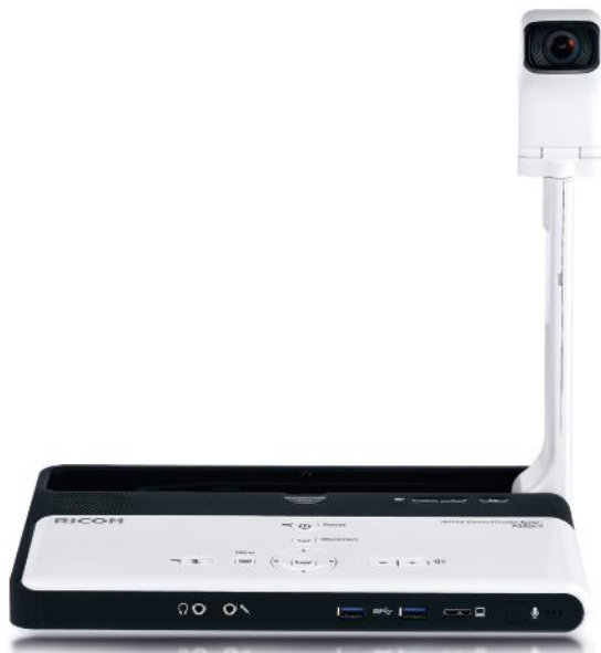
P3500M - il dispositivo di videoconferenza portatile di Ricoh.